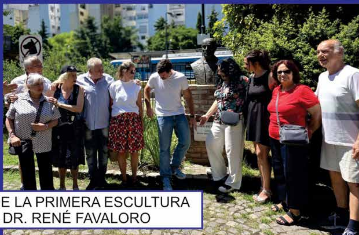
INAUGURACIÓN DE LA PRIMERA ESCULTURA EN HOMENAJE AL DR. RENÉ FAVALORO