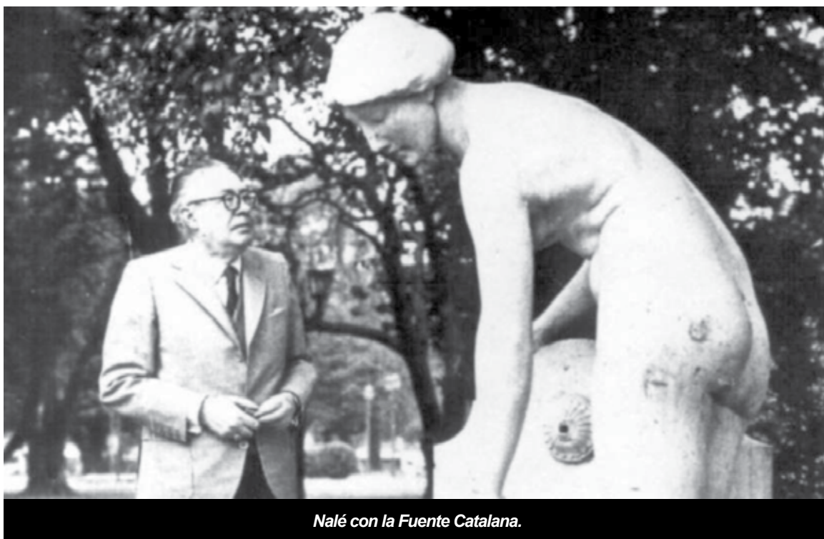
Nalé con la Fuente Catalana.