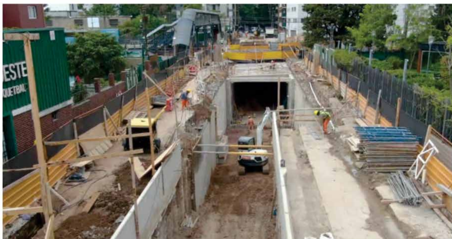
2026: Llega el Túnel de Federico García Lorca