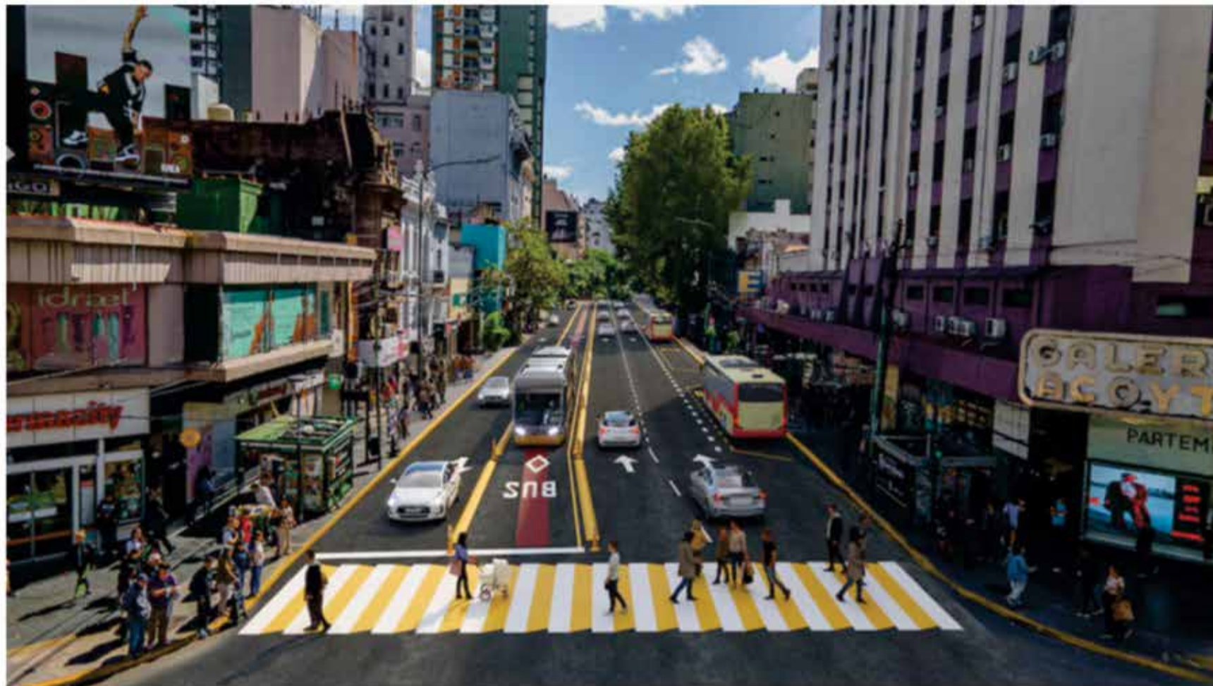
2026: Llega el Trambus a Caballito