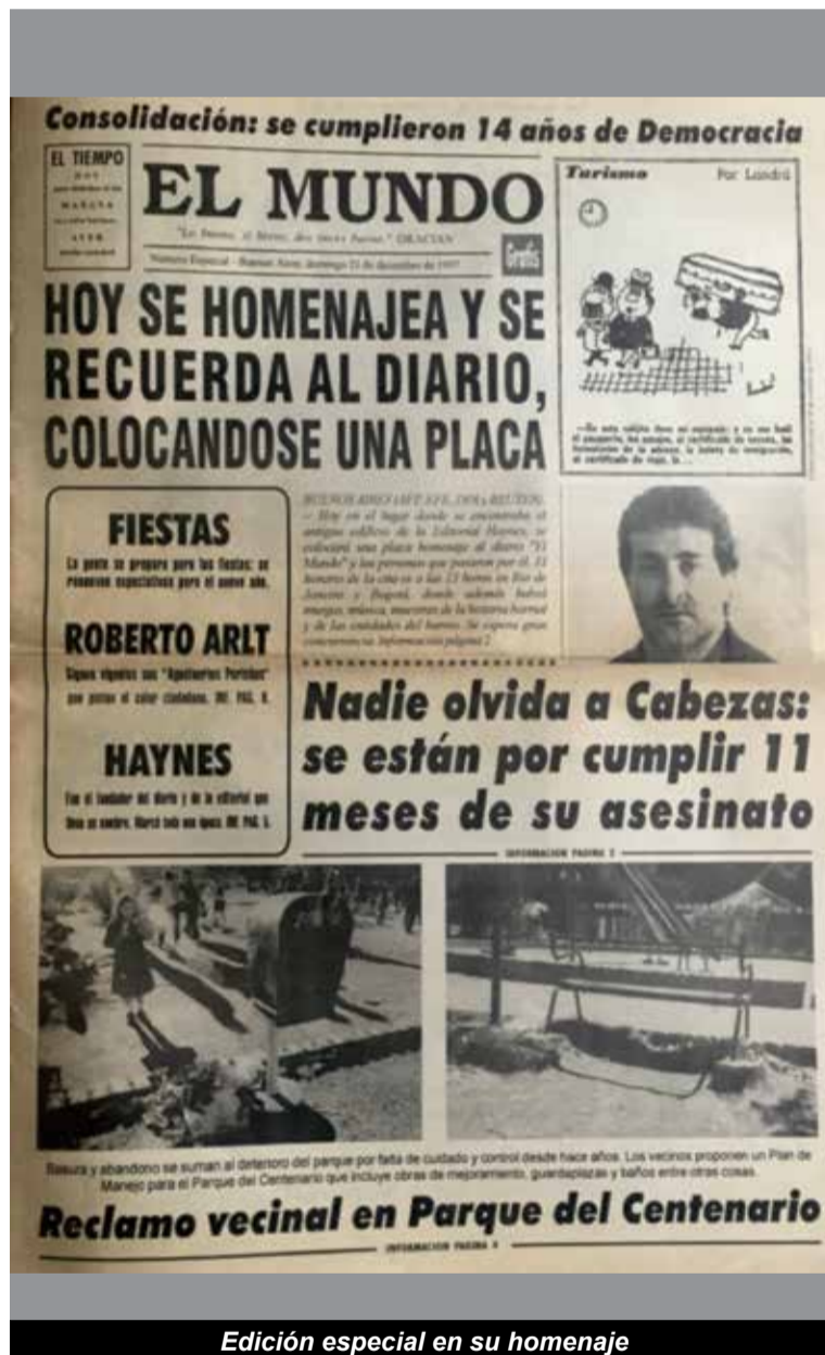
Edición especial en su homenaje

Luego, la marca fue comprada por sectores vinculados al PRT (Partido Revolucionario de los Trabajadores) y la ERP (Ejército Revolucionario del Pueblo), y lo reeditaron en los años '73 al '74, hasta su clausura.