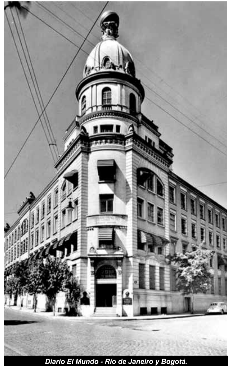
Diario El Mundo - Río de Janeiro y Bogotá.